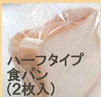
ハーフタイプ 食パン (2枚入)