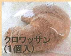
クロワッサン (1個入)